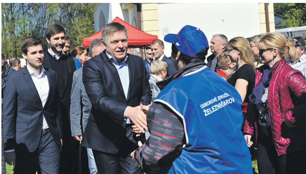
Premiér Robert Fico potešil najmä odborárov.